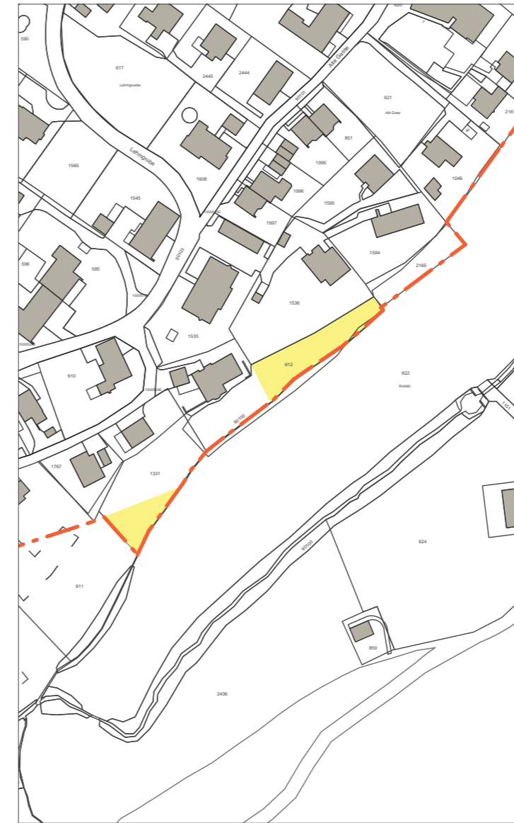
Genehmigungsinhalt der Auflage